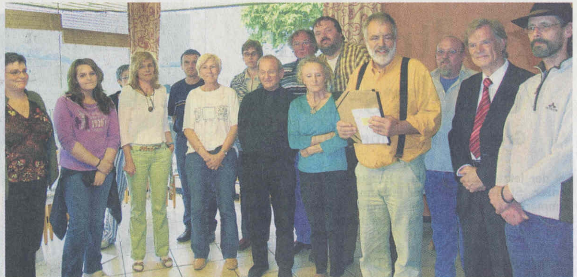
Die Teilnehmer des Mosel-Mal-Workshops in Wincheringen.